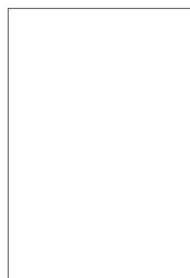
Der reiche Mann